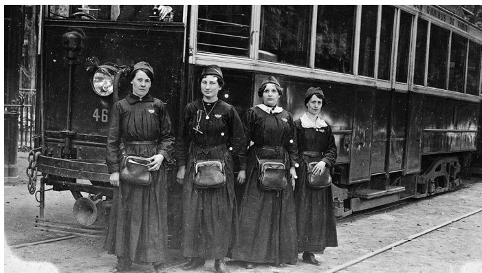
conductrices de tramway